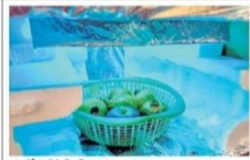
యూవీసీ వైరస్ కిల్లర్ లాంప్

• తక్కువ ఖర్చుతో తయారు చేసిన సిద్ధపత్ర యంత్రము